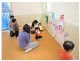
1歳講座 みんなで雪だるまチャチャチャ♪