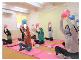
はじめてのヨガ ママも体をのばしてリフレッシュ!