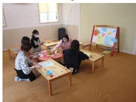
ママが作って飾ろう かわいいあんよのこいのぼりができたね♪