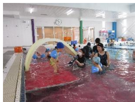
親子スイミング アンパンマンのトンネルくぐってお水の中にジャンプ！