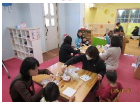
フィンガーペイント 絵の具あそび楽しかったね♪