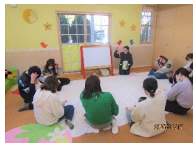
3～5ヵ月講座 かわいいおひなさま・おだいら さまに変身したね♪