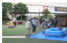
園庭開放 みんなでプール遊び！！