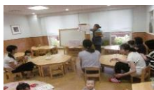
食育講座 1歳 「なすとしらす梅にゆうめん」