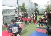
体操遊び みんなでジャンプ♪