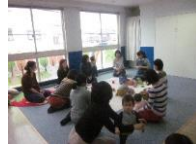
食育講座 離乳食を作った後に 食育指導士の先生に食育相談