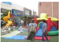
園庭開放♪ エアースベリ台もあるよ