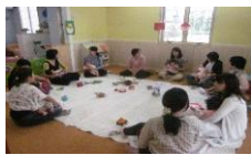
ママといっしょに おともだち こんにちは！！