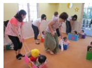
どうぶつ車で出発！ みんなで行検したよ