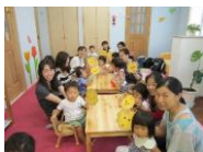
みんなでらいおん作ったよ！ せんたくばさみ遊び