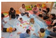
うみのなかに おさかなちゃんいたね♪