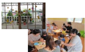
たなばたガーランド♡ かわいかったね♪