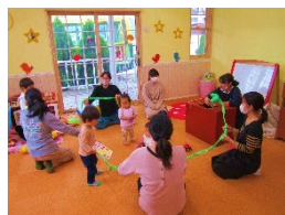
1歳講座 みんなでみつけた！ おおきなお芋♡