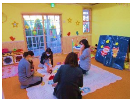
3~5ヶ月講座 はじめてのクリスマス ママとお歌嬉しいね♪